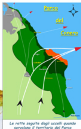
Le rotte seguite dagli uccelli quando sorvolano il territorio del Parco

Il Falco pecchiaiolo è la prima specie per numero di individui di passo migratorio al Conero. In ogni stagione si contano circa 6.000 uccelli di questa specie, mentre il numero totale dei rapaci in transito si attesta attorno alle 11.000 unità. Da pochi anni alcune coppie di questo splendido rapace si fermano a nidificare nei boschi del monte Conero, inviolando ogni estate dai cinque ai sette giovani.