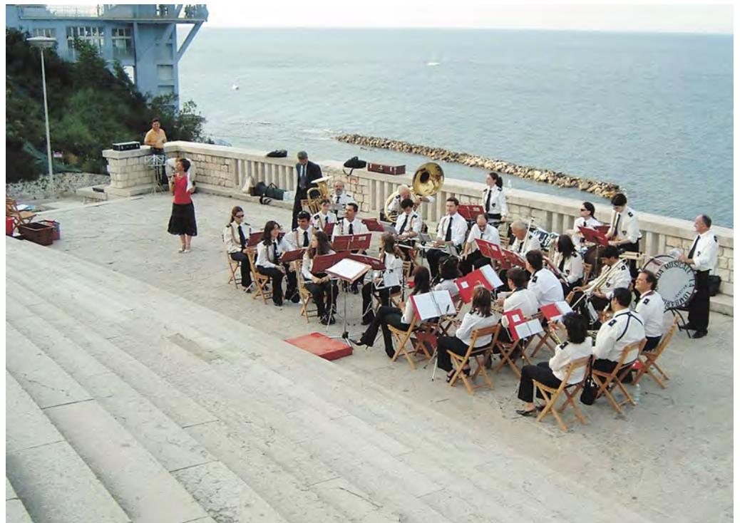
Passetto: un momento dell'estate 2005.