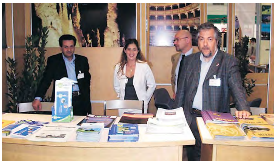
Barcellona: lo stand con i materiali del nostro Parco.