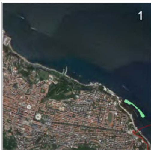
Fig. 1: distribuzione dei popolamenti a Lithophaga lithophaga nelle vicinanze del sito oggetto di intervento, tratto dalla Caratterizzazione biocenotica e restituzione cartografica per l'individuazione di eventuali habitat e specie di interesse comunitario nelle aree prospicienti le Aree Protette delle Marche redatto dal Disva dell'Università Politecnica delle Marche per la Regione Marche.

in minor parte sulle biocenosi tutelate rientranti all'interno dei Siti Natura 2000, per i quali lo scrivente Parco del Conero è Ente Gestore, si raccomanda alla Regione Marche, che legge per conoscenza, di prendere in considerazione le misure di mitigazione e prescrizioni sopra elencate, per la tutela delle biocenosi marine presenti al di fuori dei perimetri dei Siti Natura 2000, la cui distribuzione è rappresentata nelle figure sotto riportate.